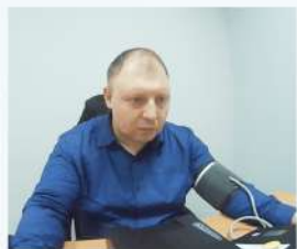
Измерение давления и пульса

Тестовый Водитель Компании прошел предрейсовый медицинский осмотр к исполнению трудовых обязанностей допущен 06-09-2023 13:44:29 (МСК) Медработник: Тест_Проверка Медина Тестовое представительство Лицензия №_ТестоваЛицензия от 10-10-2020 г., бессрочно УКЭП 8ВВ5904375А359Е4 Осмотр № 1 6664633 МЕДБАНК.РФ